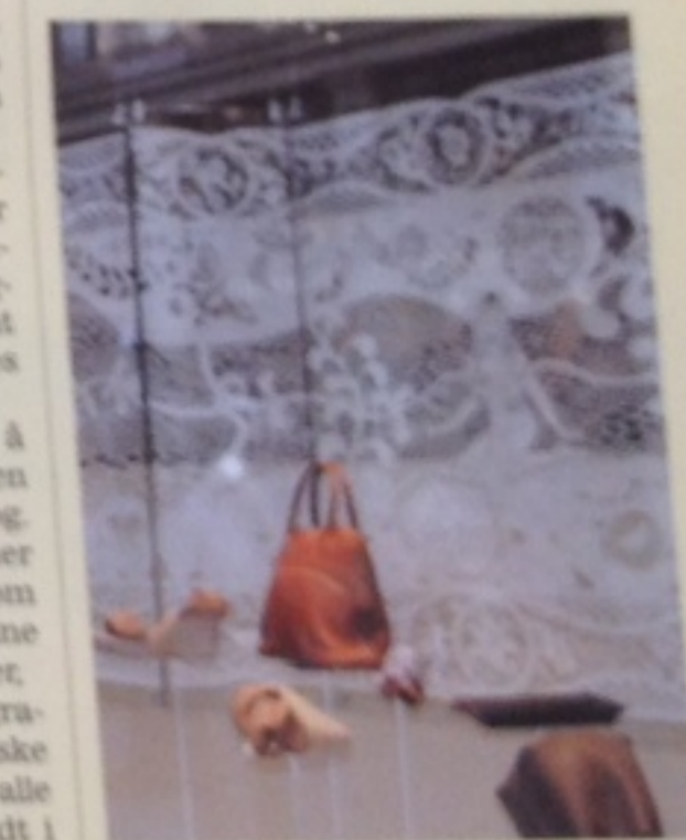
HERMÈS-KLIPPET: Det franske motehuset Hermès bestilte et papirkunstverk som en del av vindusutstillingen i København og i Oslo. Det eneste verktøyet hennes er en broderisaks.