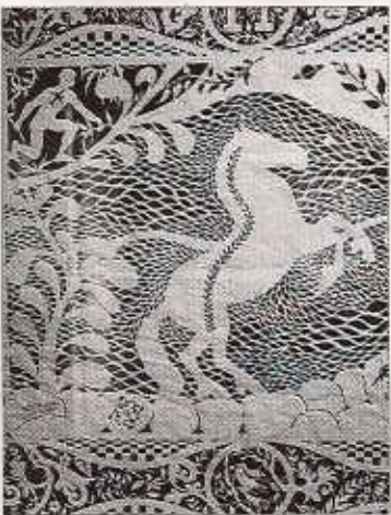
Yksityiskohta tilausteoksesta Hermés-muotitalolle.

Sieltä tultiin ja neuvottiin pitämään näyttely.